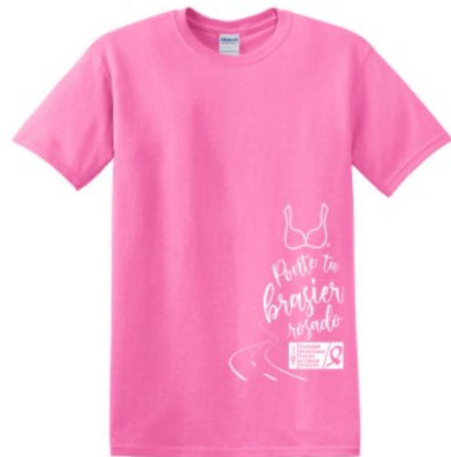
T-Shirt Adulto (Unisex) Sobrevivientes 2020